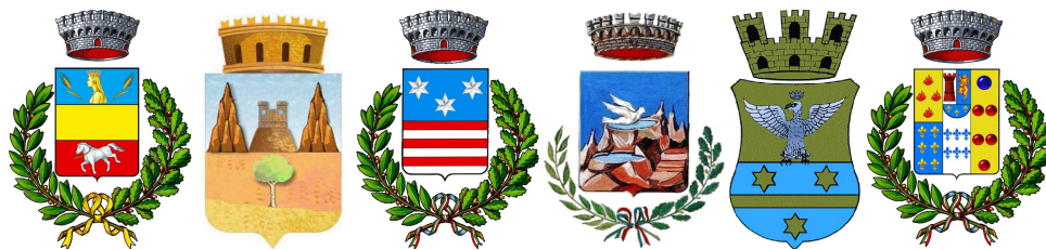
Comune di Castellana Sicula Comune di Collesano Comune di Geraci Siculo Comune di Gratteri Comune di Isnello Comune di Montemaggiore Belsito