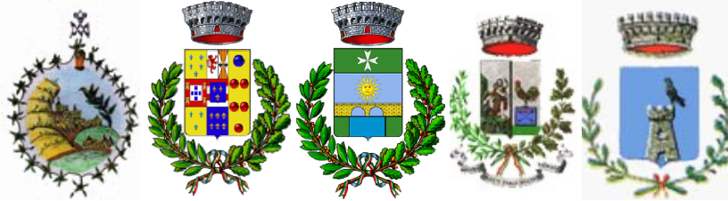
Comune di Alimena Comune di Aliminusa Comune di Blufi Comune di Bompietro Comune di Caltavuturo