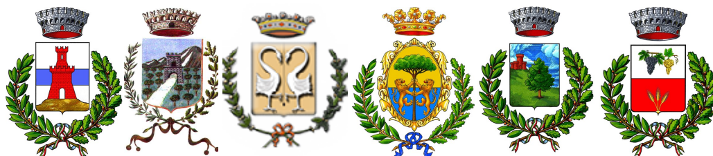
Comune di Sciarra Comune di Scillato Comune di Sclafani Bagni Comune di Sperlinga Comune di Valledolmo Comune di Vallelunga Pratameno